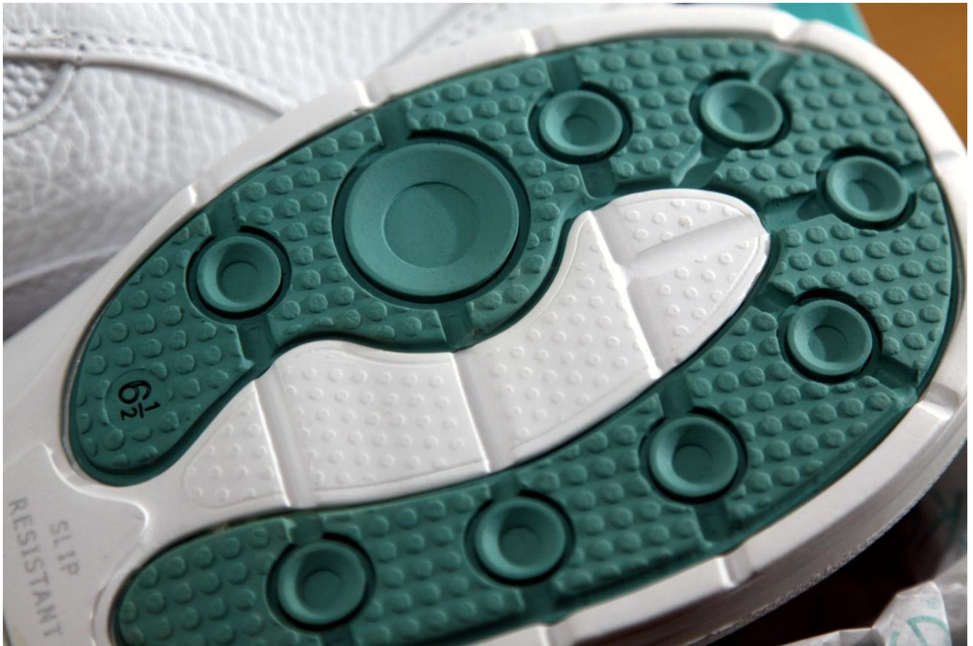
好重要嘅防滑鞋底 – 真是合意的設計.