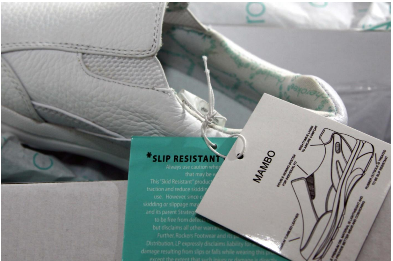
舒適的綿質內履物料，吸汗透氣.